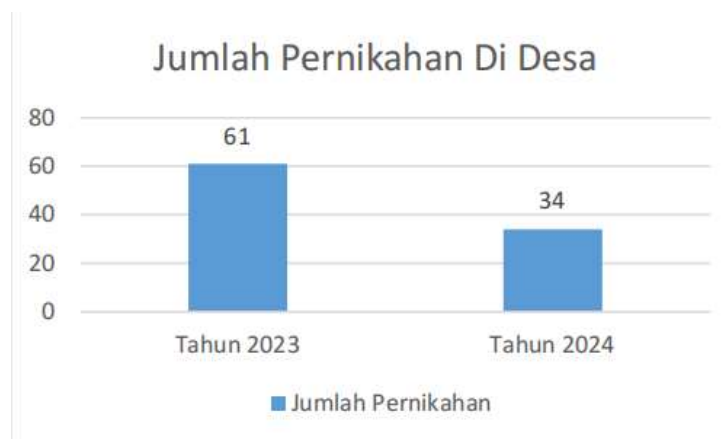
Diagram jumlah pernikahan pada tahun 2023-2024 :

Sumber : Diolah dari Pemerintah Desa Gelang (2025)